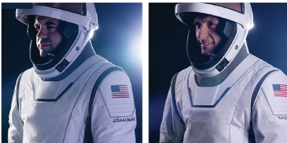
जेरेड आइसेकमैन मिशन कमांडर